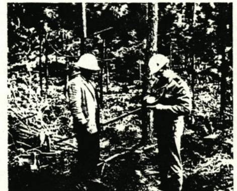
Witwaters-bos Privaatsak X803 Witrivier 1240

Die Redakteur Die Staatsamptenaar Posbus 40404 Arcadia 0007